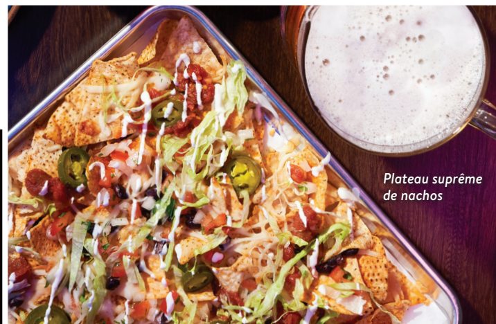
Plateau suprême de nachos