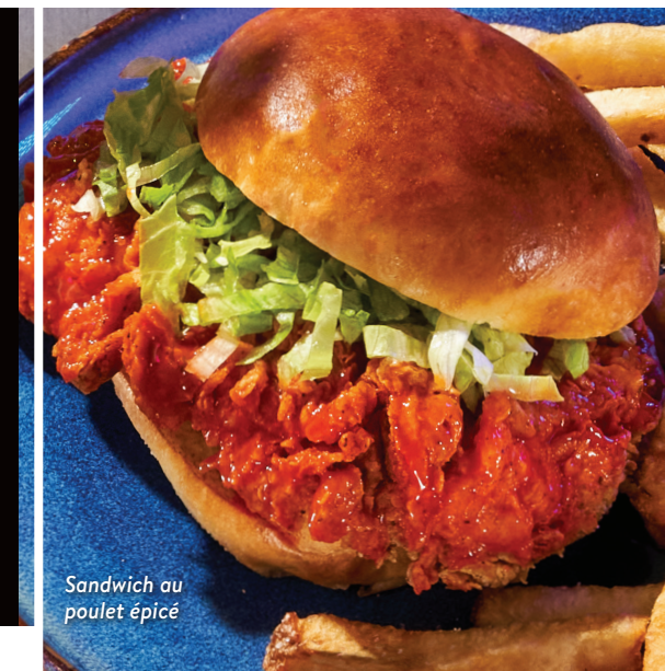
Sandwich au poulet épicé

Galette Impossible MC à base de plantes, oignons, cornichons, laitue, sauce The Rec Room, pain brioché grillé 21