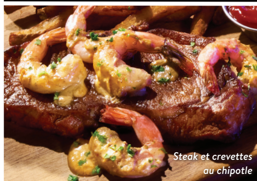
Steak et crevettes au chipotle

Paleron de bœuf AAA de 8 oz, crevettes, beurre au chipotle, frites maison 38 PASSER à un contre-filet de bœuf AAA coupe New York de 10 oz 10