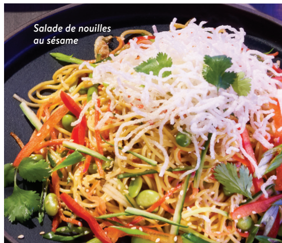
Salade de nouilles au sésame

AJOUTER avocat 6 | tofu croustillant 6 | poulet grillé 8 crevettes grillées 9 | saumon de l'Atlantique grillé 12