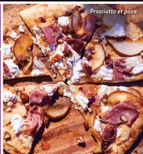
Prosciutto et poire

Champignons rôtis, fromage de chèvre, oignons caramélisés, sauce à la crème, ciboulette, piments broyés 17