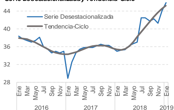
Indicador de Confianza del Consumidor, Serie Desestacionalizada y Tendencia-Ciclo