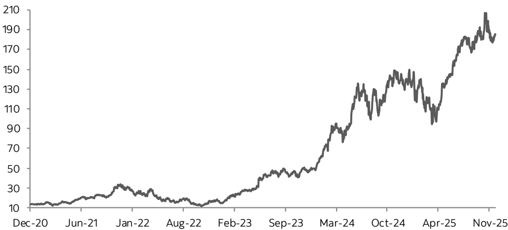
Evolución histórica del subyacente