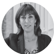
Mónica Zalaquett Said Ministra de la Mujer y la Equidad de Género