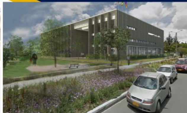
Vista desde la Transversal 78k