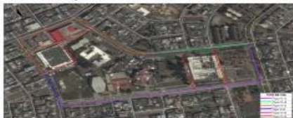
Zona de Influencia Malla Vial