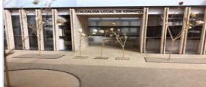
Acceso Principal Edificio – Fachada Oriental