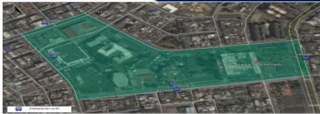
Paraderos de rutas del sistema integrado de transporte dentro del área de influencia.

En la actualidad en el área de estudio circulan diferentes rutas de transporte público colectivo y SITP las cuales usan principalmente los corredores de la Carrera 79, Calle 42 sur, Transversal 78 J y la Calle 41 sur