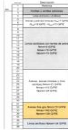
Perfil estratigráfico del suelo

En la actualidad en el área de estudio circulan diferentes rutas de transporte público colectivo y SITP las cuales usan principalmente los corredores de la Carrera 79, Calle 42 sur, Transversal 78 J y la Calle 41 sur