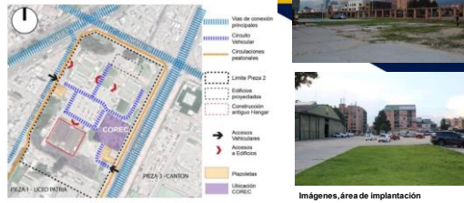
Imágenes, área de implantación