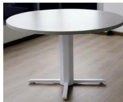
* Fotografía de ítem MBF-2

(Certificado de garantía técnica de calidad / Fondo Financiero de Proyectos de Desarrollo - FONADE / Contrato No. 2162139)