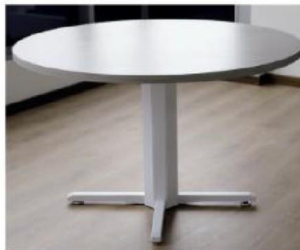
* Fotografía de Item MBF -2

* Patas en sistema de araña, con niveladores elásticos de 5/16"