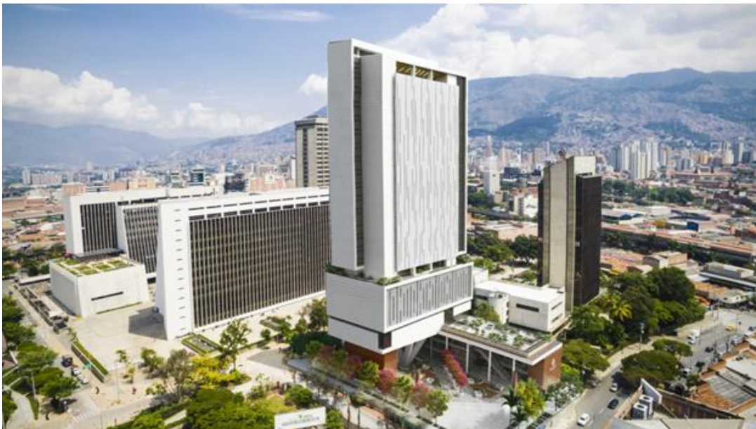
Ilustración 2: Vista general del nuevo edificio de tribunales de Medellín