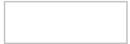
Firma del Cliente (con lapicero tinta negra, sin sobrepasar el recuadro)

_____ Sello y Firma del Responsable de la Atención