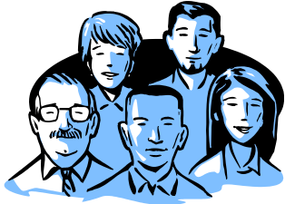
Gpo 1: Administración

Los grupos determinan qué operaciones pueden hacer los usuarios