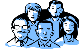
Gpo 2: Contaduría